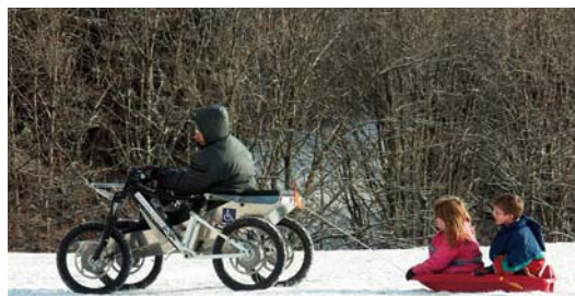
Le fauteuil roulant électrique tout-terrain de Coccinelle permet aux personnes handicapées de faire des ballades en famille.

fauteuil électrique tout terrain. Le Prix d'Honneur de 20 000 € a été décerné à l'association Parenthèse pour son projet de maison d'accueil temporaire, « les temps d'souffler ».